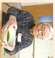
お抹茶でお正月気分